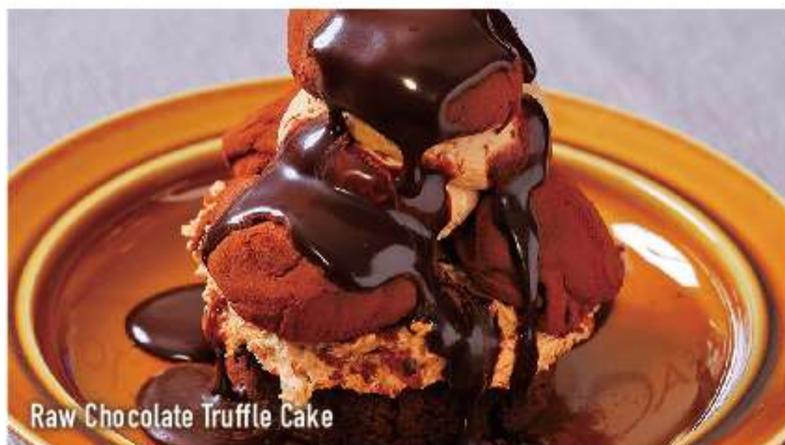
Raw Chocolate Truffle Cake