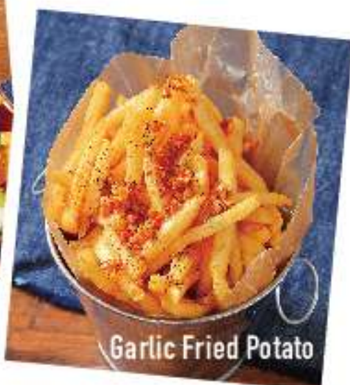
Garlic Fried Potato