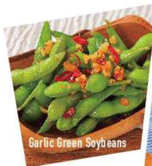
Garlic Green Soybeans

スモーク・ツナディップ 490 Smoked Tuna Dip (税込 529) スモーキーなツナマヨネーズ、 サクサクメルバトーストと一緒に!