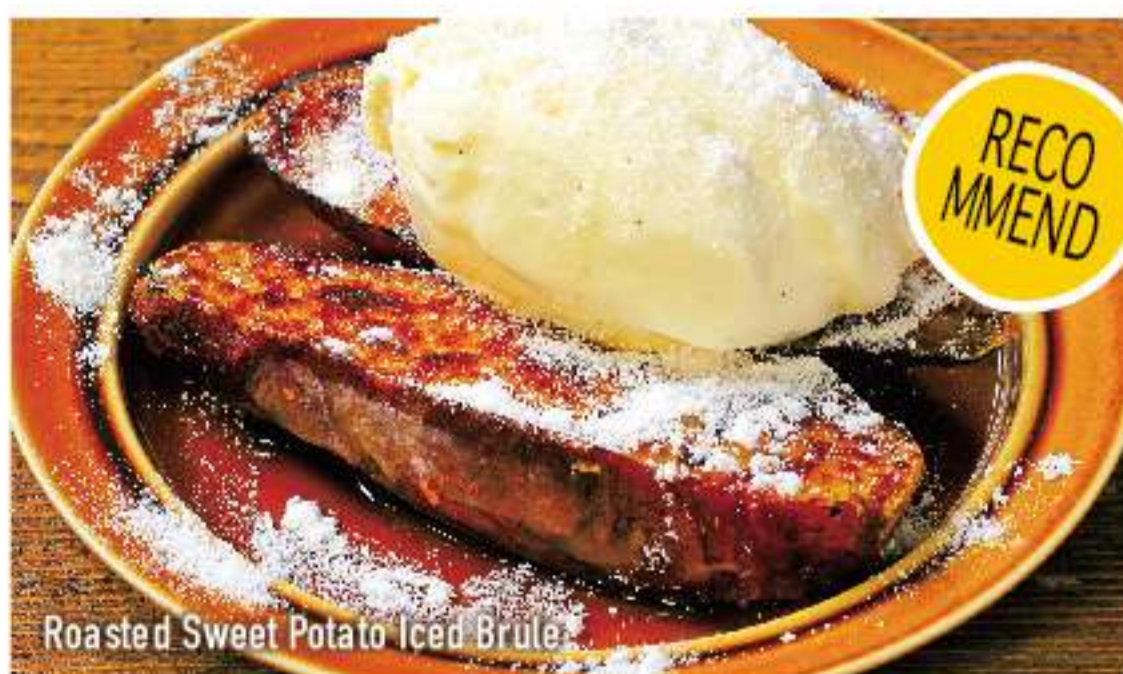
Roasted Sweet Potato Iced Brulee