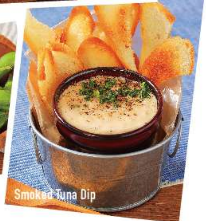
Smoked Tuna Dip